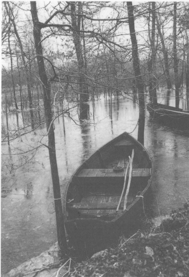
La « plate à Racineux ».

En couverture : Plate de pêcheur, sous voile. Encre de Jacky Louineau.